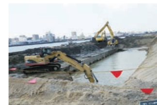
大江ふ頭岸壁改良工事