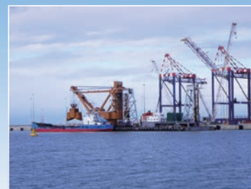
〈南アフリカ〉 ポートエリザベス市 クーハ港浚渫工事