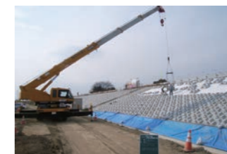
平成27年度 庄内川山田護岸工事

名古屋市港区の国道302号線沿線で開催中の名古屋環状2号線。この工事では、約10mの高さとなる新しい橋脚(橋梁下部)2基を製作しました。