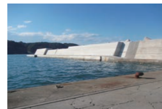
小港漁港災害復旧工事

「新海面処分場」は東京都が資源利用できない廃棄物等を処分する場所です。新海面Dブロックは、焼却灰や下水汚泥など埋立て後の飛散防止や汚水処理等の管理が必要な廃棄物を埋め立てる護岸建設です。