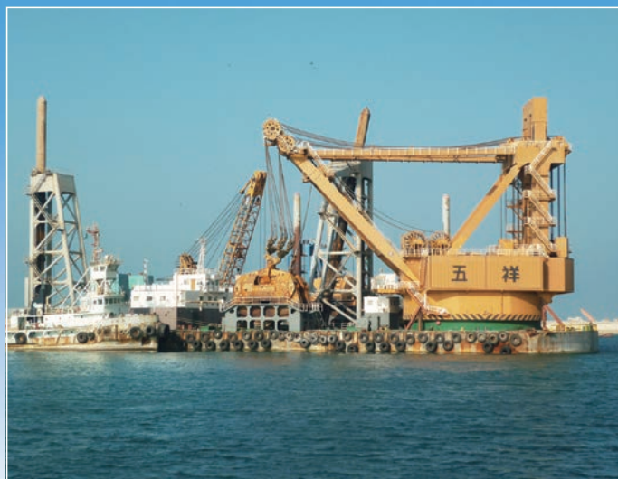
〈サウジアラビア〉 ラーズ・アル・ザワール港浚渫工事