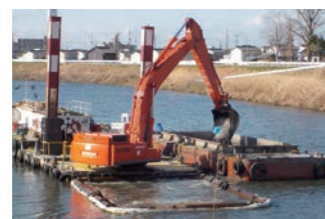
総合治水対策特定河川工事 (全国防災)(8号工)