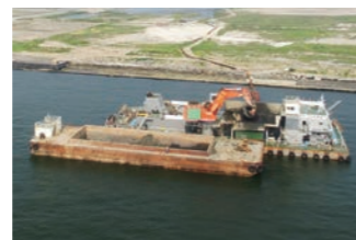
釜地区航路・泊地 (-11m)外浚渫工事

釧路港西港区において、泊地(-14m)の水深確保を目的とした浚渫工事であり併せて、浚渫した土砂はバージアンローダー船で揚土し、釧路港西港区第5埠頭の埋立材として活用しています。